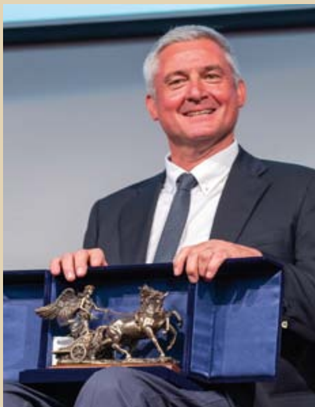
PREMIO “Alla carriera – OffCarr” Oscar De Pellegrin