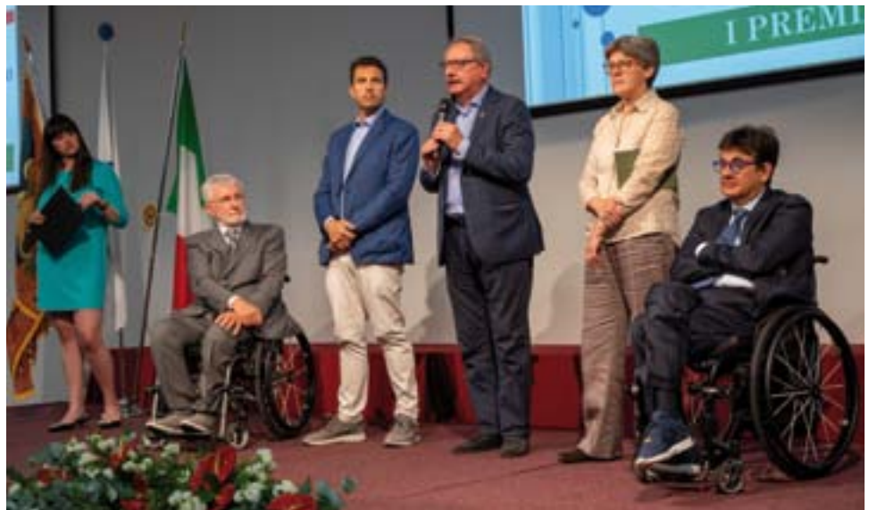
Il saluto delle autorità.

Il secondo è stato consegnato al massimo esponente dello sport paralimpico italiano, l'avv. Luca Pancalli , come segno di gratitudine e riconoscenza per l'impegno profuso nella promozione dello sport tra le persone disabili e nella diffusione dei valori su cui si fonda il Comitato Italiano Paralimpico.