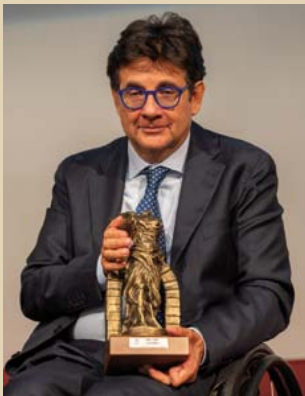
PREMIO L'OLIMPO Luca Pancalli