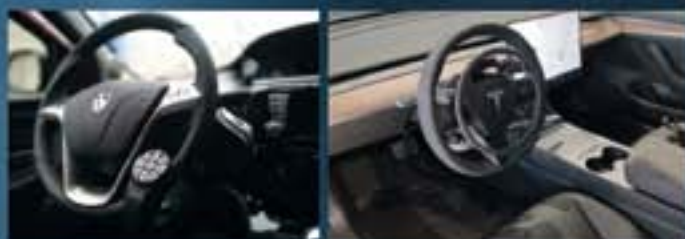
DISPOSITIVI DI GUIDA