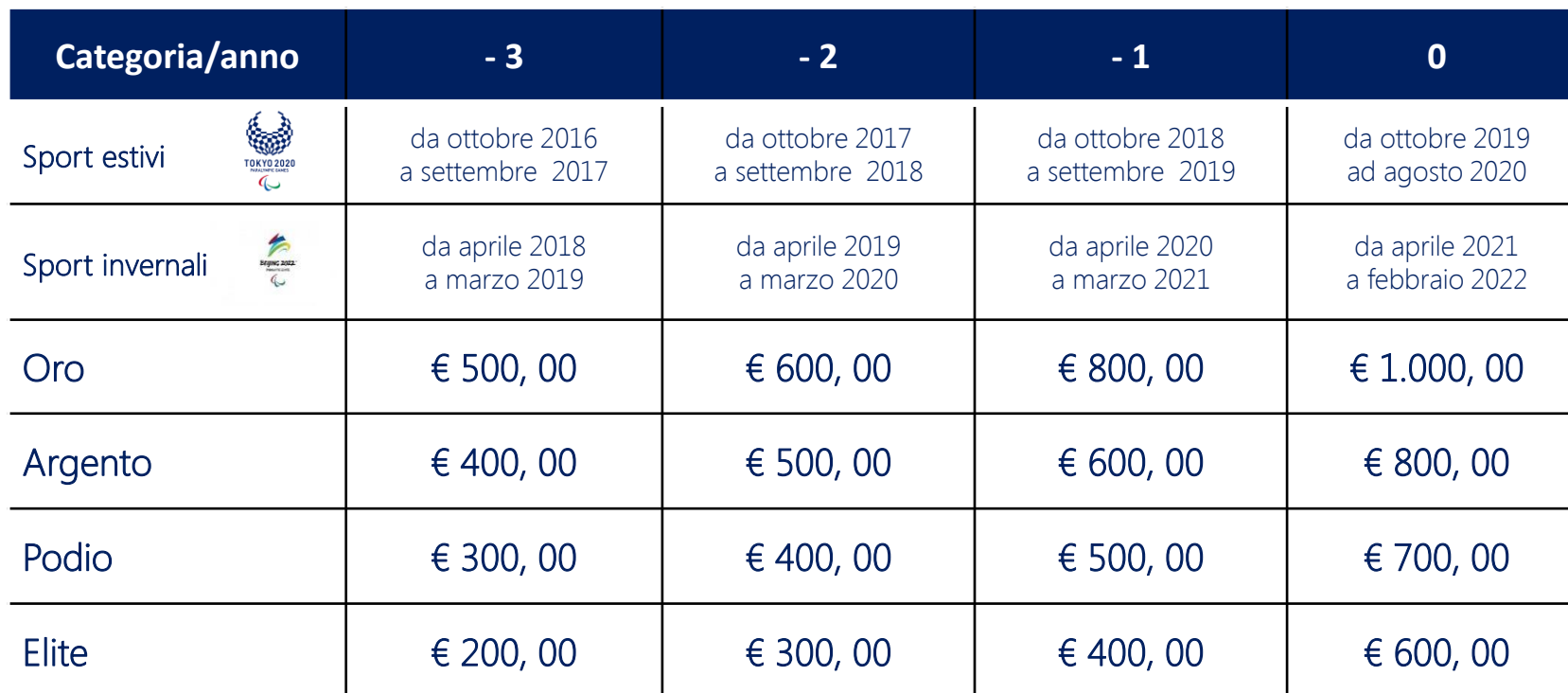
Tabella degli Assegni mensili di preparazione