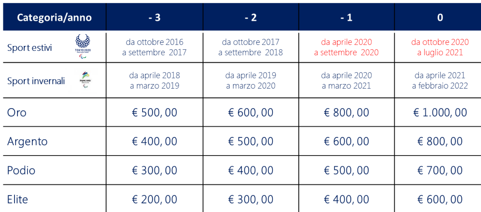
Tabella degli Assegni mensili di preparazione