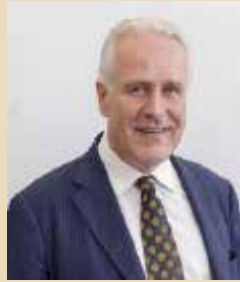
Eugenio Gianì PRESIDENTE

Mi complimento e ringrazio quindi di cuore gli atleti, i dirigenti e i tecnici toscani che hanno partecipato alle Paralimpiadi di Tokyo 2020 per le emozioni e le soddisfazioni che ci hanno regalato e il Comitato Paralimpico Regionale Toscana per la sempre attenta e impeccabile organizzazione. Avete onorato lo sport e testimoniato ancora una volta come il linguaggio sportivo sia universale, superi confini, lingue, ideologie e possieda la capacità di unire le persone, creando ponti e favorendo il dialogo e l'integrazione, valori tutti nei quali la Toscana crede fortemente.