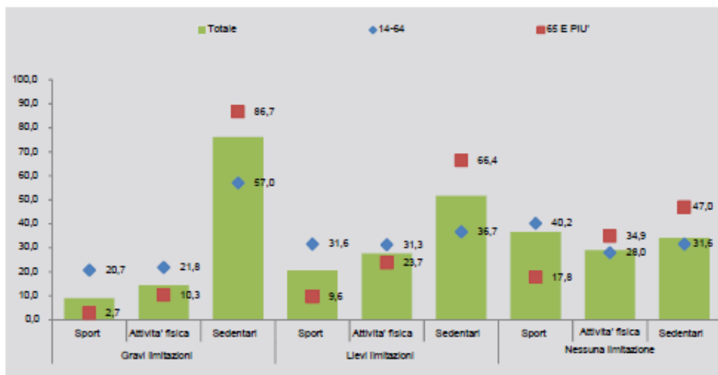
Tabella 1: Persone di 14 anni e più, per pratica di sport e attività fisica, per ripartizione geografica e gravità delle limitazioni. Media 2016-2017 (valori percentuali)

Fonte: Istat, Aspetti della vita quotidiana.